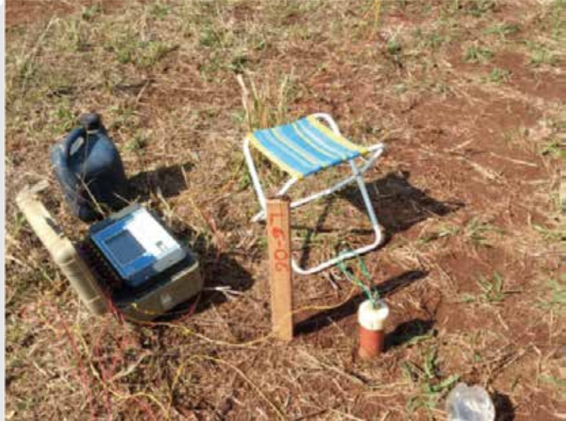
Execução de Polarização Induzida (IP)