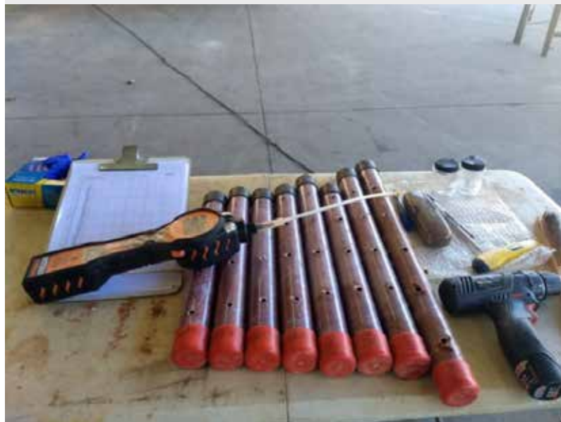
Coleta amostras (liner) e medida de VOC