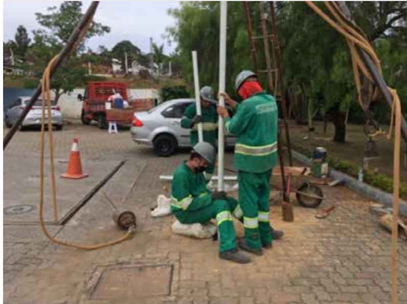
Instalação de Poço de Monitoramento