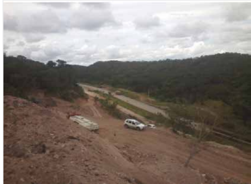
Obra para estabilização de talude e recuperação de rodovia