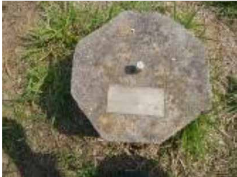
Implantação de marco topográfico