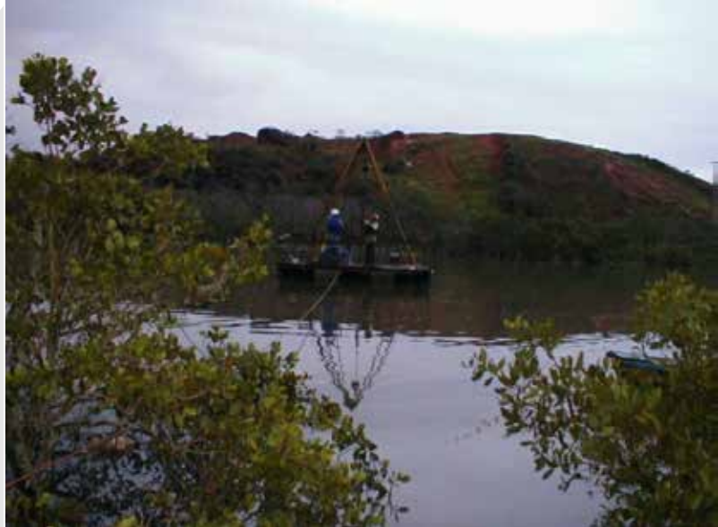
Execução de sondagens a percussão sobre flutuante