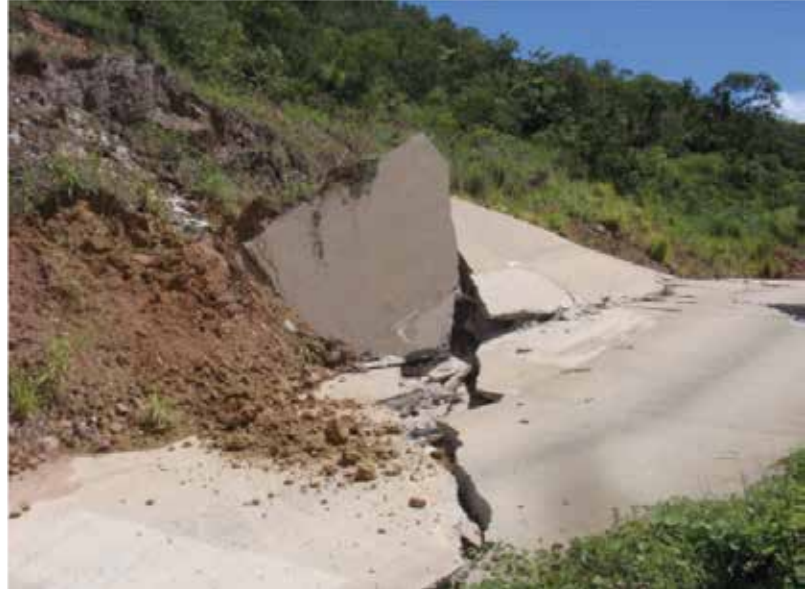
Ruptura de talude em Rodovia