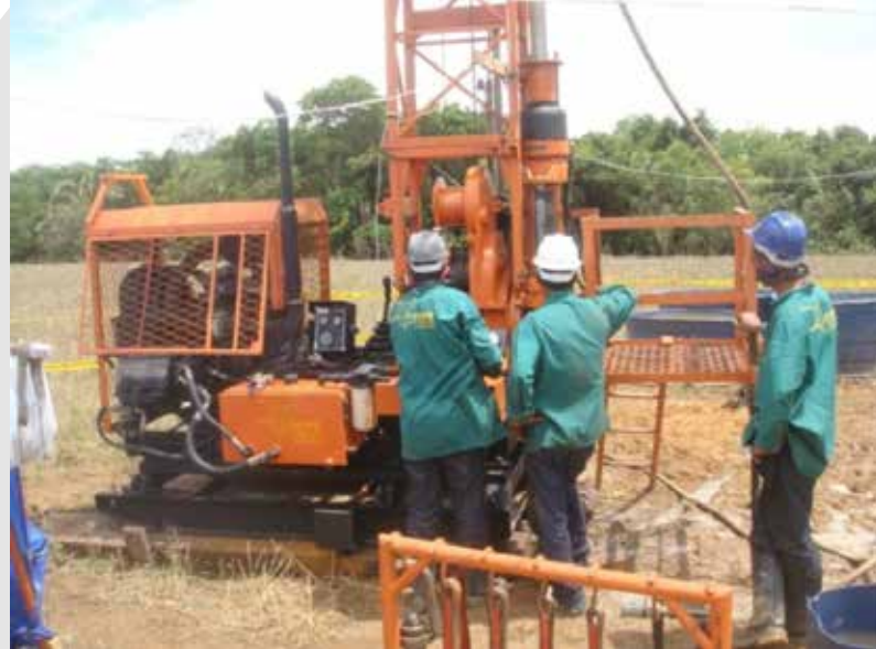
Sonda rotativa Sondeq SS-51