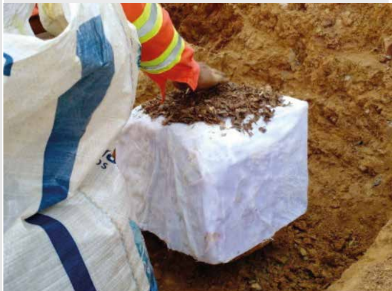
Talhagem de blocos indeformados