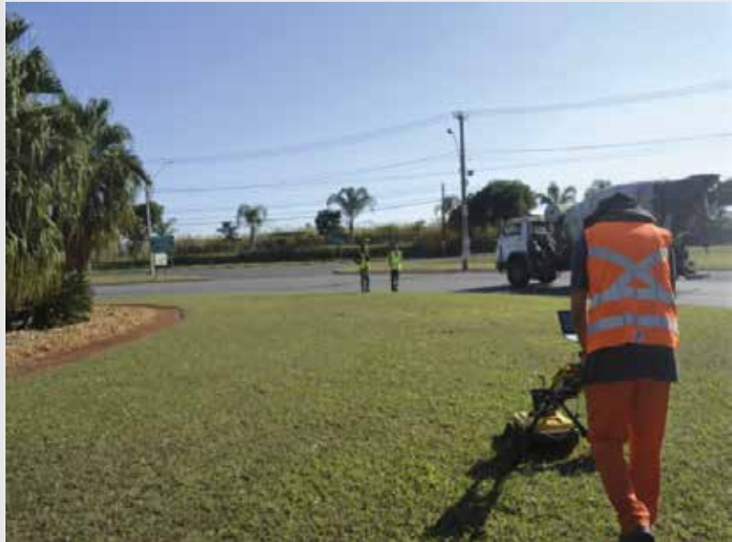
Mapeamento de interferências enterradas (GPR)