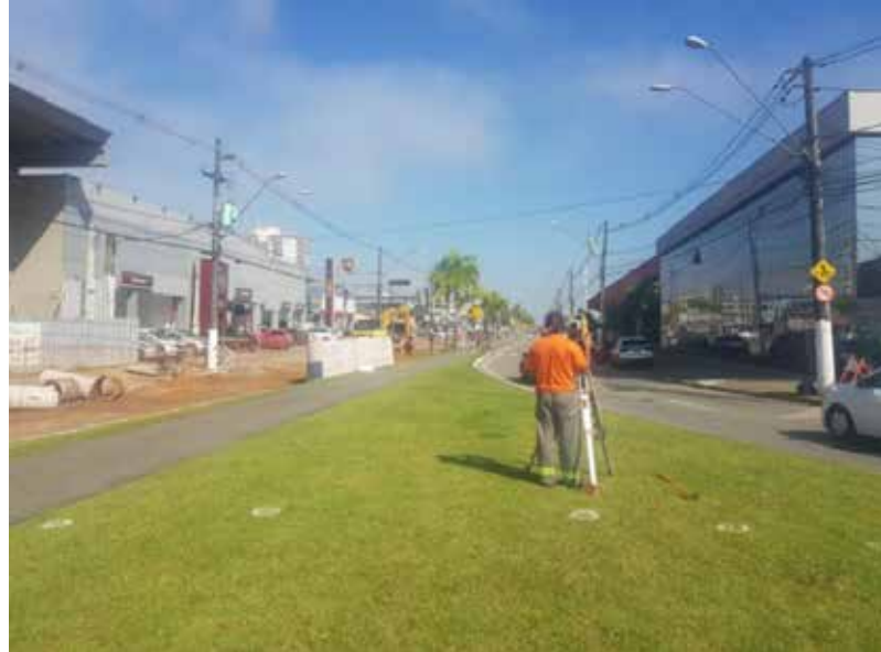
Execução levantamento planialtimétrico cadastral